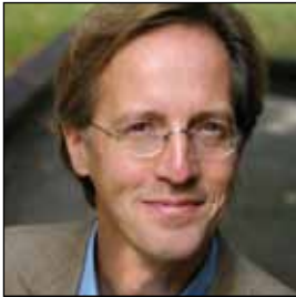
Prof. dr. Robbert Dijkgraaf

Universiteitshoogleraar mathematische fysica Universiteit Amsterdam, president van de KNAW (Koninklijke Nederlandse Akademie van Wetenschappen), was lid van het landelijk Innovatieplatform 2